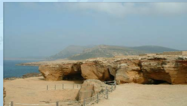
LES ZONES SENSIBLES LITTORALES